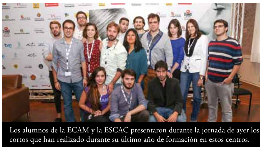
Los alumnos de la ECAM y la ESCAC presentaron durante la jornada de ayer los cortos que han realizado durante su último año de formación en estos centros.