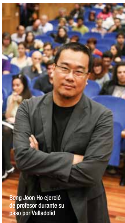
Bong Joon Ho ejerció de profesor durante su paso por Valladolid

Durante la clase magistral, el autor surcoreano de Mother y Crónica de un asesino