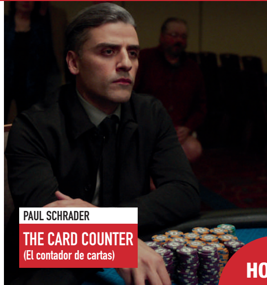
PAUL SCHRADER THE CARD COUNTER (El contador de cartas)