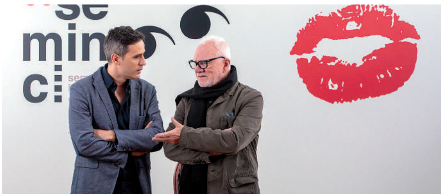
González Bermúdez y Malcolm McDowell en la presentación de La naranja prohibida

«Es el festival al que más veces he venido: casi todas mis películas han pasado por aquí»