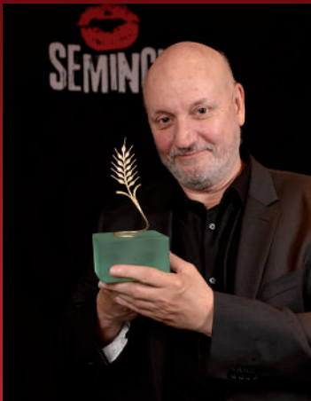
JUAN JOSÉ CAMPANELLA CELEBRA SU ESPIGA DE HONOR