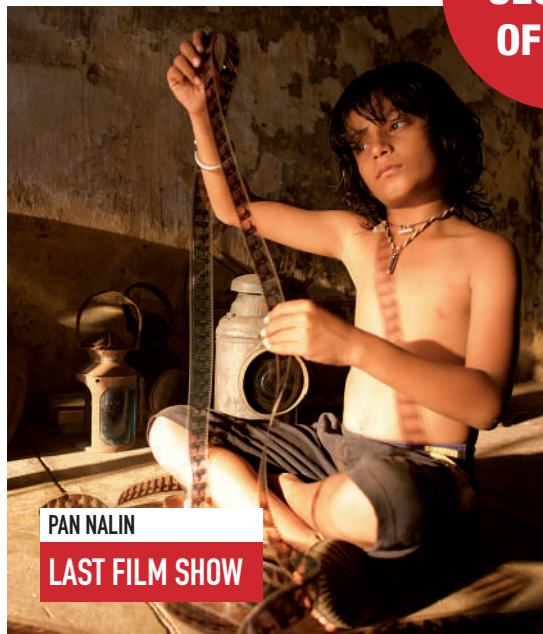
PAN NALIN LAST FILM SHOW