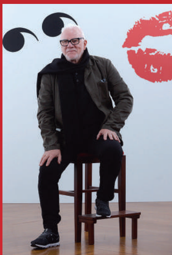
MALCOLM McDOWELL ARROPA LA PRESENTACIÓN DEL DOCUMENTAL LA NARANJA PROHIBIDA