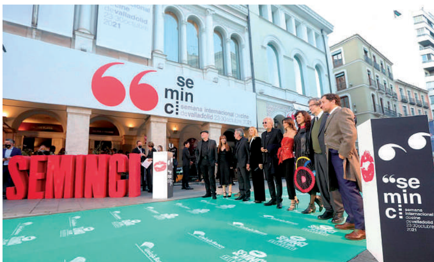
Cineastas argentinos acompañan a Campanella antes de recibir la Espiga de Honor