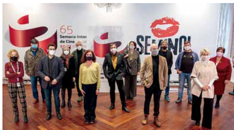
Participantes en el encuentro entre Acción y el ICAA

«Un sector que siempre ha parecido dividido en busca de una causa común está ahora en la misma idea de que es necesario un cambio de paradigma, que tenemos que acercarnos a otras cinematografías europeas que hace años invierten en cultura de una forma mucho más contundente que España», destacó el presidente de Acción, Juan Vicente Córdoba.