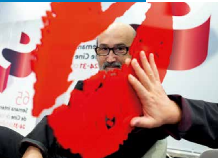
Javier Cámara protagonizó la primera clase magistral de la 65 Seminci