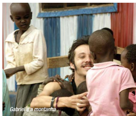
Gabriel e a montanha

Trabajos procedentes de Turquía, Estados Unidos y Brasil coinciden el miércoles en la Sección Oficial de esta 62ª Semana. En Daha , Onur Saylak recoge la historia de un niño que colabora con su padre en el próspero negocio del tráfico de refugiados hacia Europa. En The Rider , de Chloé Zhao , el protagonista es una estrella del rodeo que ve roto su futuro tras un accidente de caballo. Y el brasileño Fellipe Barbosa pone en imágenes el viaje de un joven al corazón de África ( Gabriel e a montanha ).