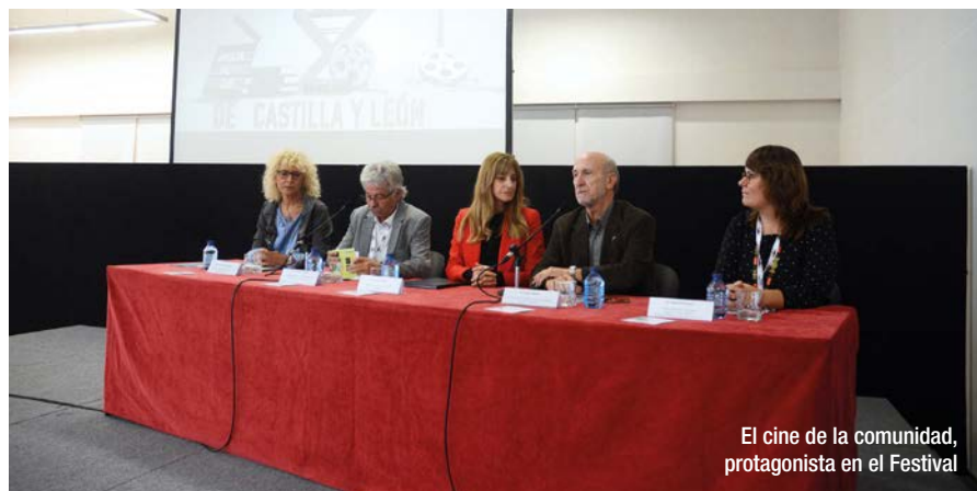
El cine de la comunidad, protagonista en el Festival

Ya está muy visto hacer banquetes y baile en las celebraciones. Lo que se impone ahora es elaborar un balance, recorrer las gestas y presentar nuevas batallas. Así se ha demostrado en Valladolid en el marco del Día del Cine y del Audiovisual .