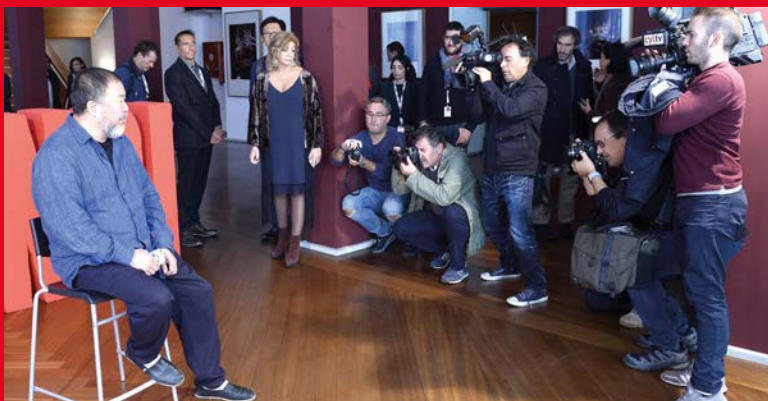
Gran expectación en la presentación de Human Flow (Marea humana), de Ai Weiwei