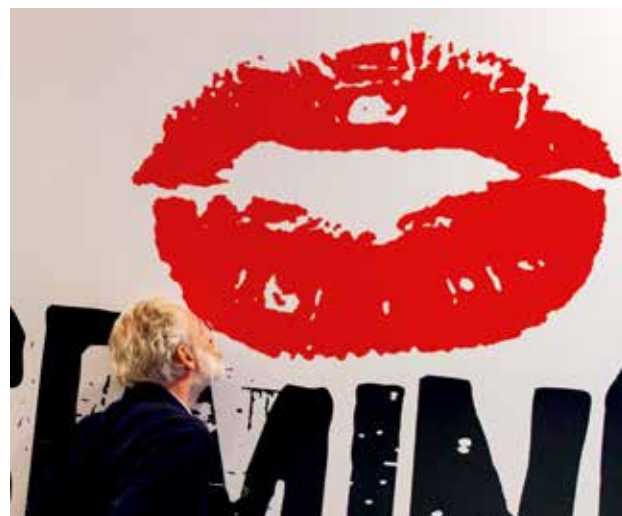
Pasolini posa ante el logotipo de la Seminci

A partir de ese momento Pasolini siguió el proceso habitual en este tipo de proyectos tan personales: investigó sobre las circunstancias que afectan a la historia, especialmente lo