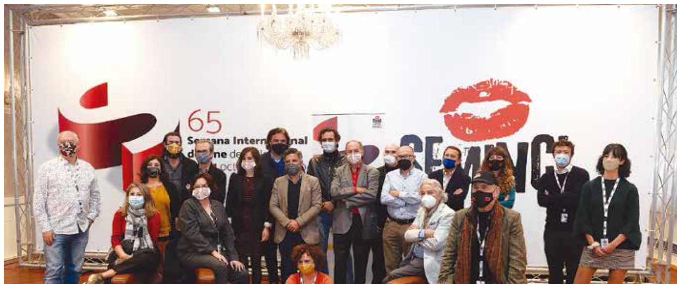
Directores, distribuidoras y el ICAA participaron en el Encuentro de Distribución celebrado ayer

multinacionales «a la que Europa, España incluida, ha dejado que se sometieran sus mercados», lo que es especialmente preocupante en el caso de películas españolas subvencionadas «que dichas compañías se resisten a estrenar». «Quedan patentes los claroscuros que conlleva la creciente implantación de las plataformas. Frente a la facilidad de acceso a los contenidos que permiten a los usuarios, se alude a su influencia en la uniformización del gusto, la fragmentación de la experiencia audiovisual, la facilidad de que sean pirateados sus productos audiovisuales y su negativa repercusión en la supervivencia de las salas, que todos los participantes en el Encuen-