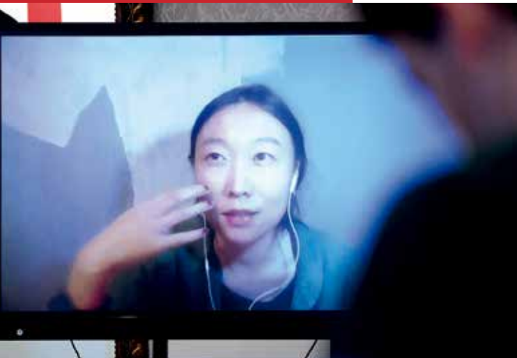
Zheng Lu Xinyuan interviene en la rueda de prensa