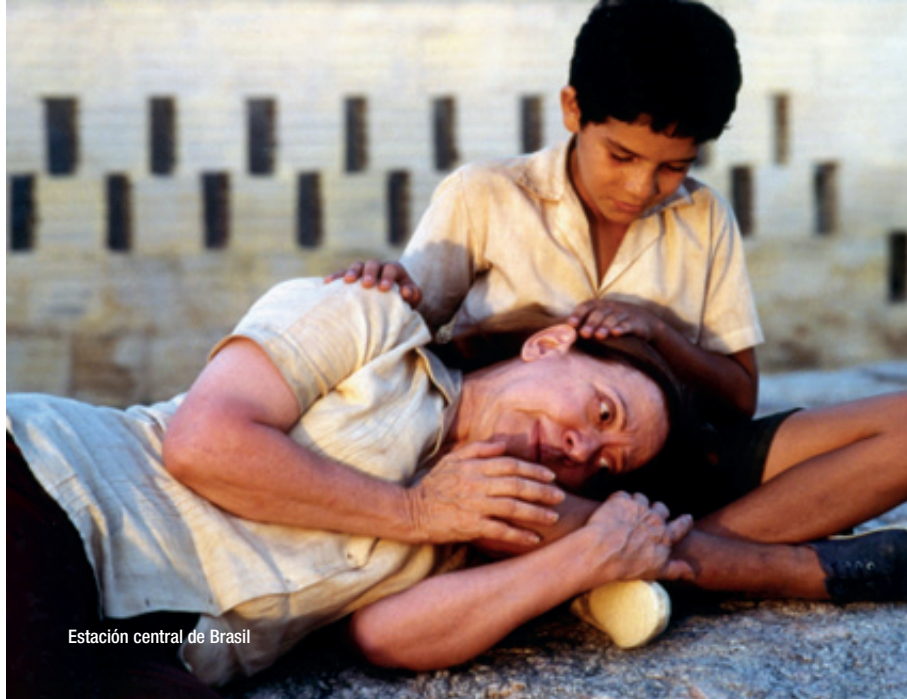
Estación central de Brasil