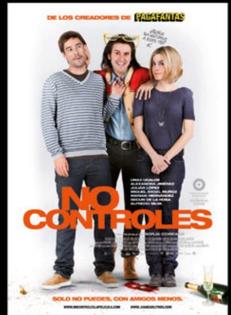
NO CONTROLES de Borja Cobega SAYAKA PRODUCCIONES TELESPAN 2000 ANTENA 3 FILMS