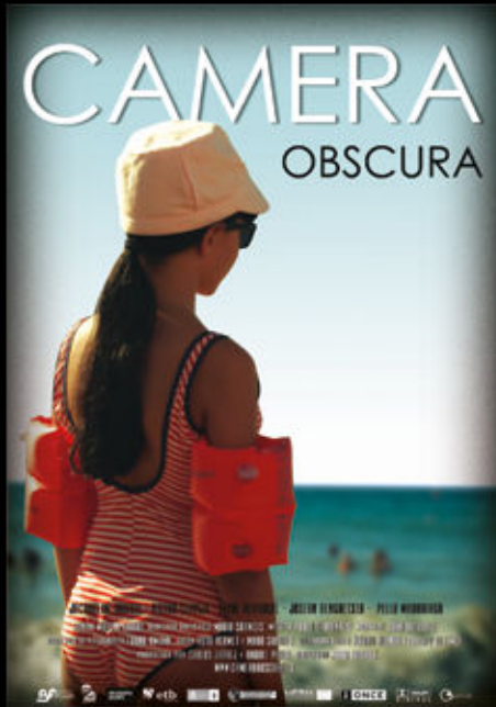
CAMERA OBSCURA de Maru Solores BASQUE FILMS

Apoiando las producciones vascas seleccionadas en la 56 edición de la SEMINCI