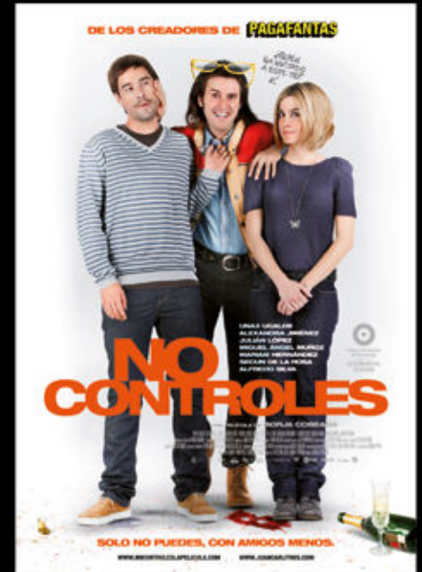
NO CONTROLES de Borja Cobega SAYAKA PRODUCCIONES TELESPAN 2000 ANTENA 3 FILMS