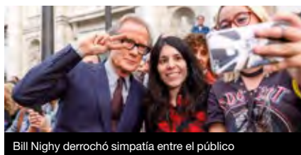
Bill Nighy derrochó simpatía entre el público