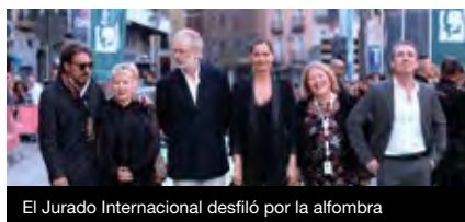
El Jurado Internacional desfiló por la alfombra