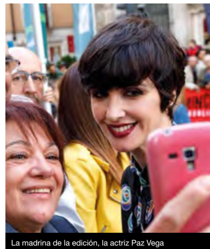
La madrina de la edición, la actriz Paz Vega