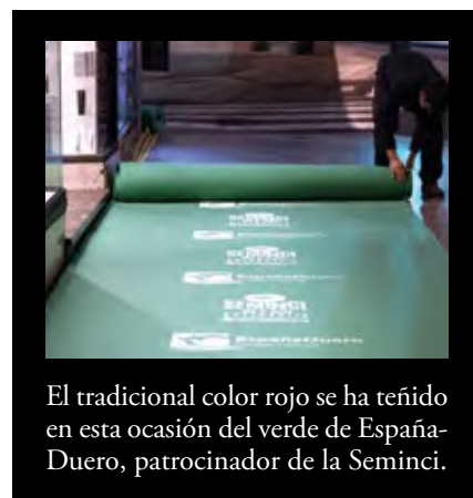
El tradicional color rojo se ha teñido en esta ocasión del verde de España-Duero, patrocinador de la Seminci.