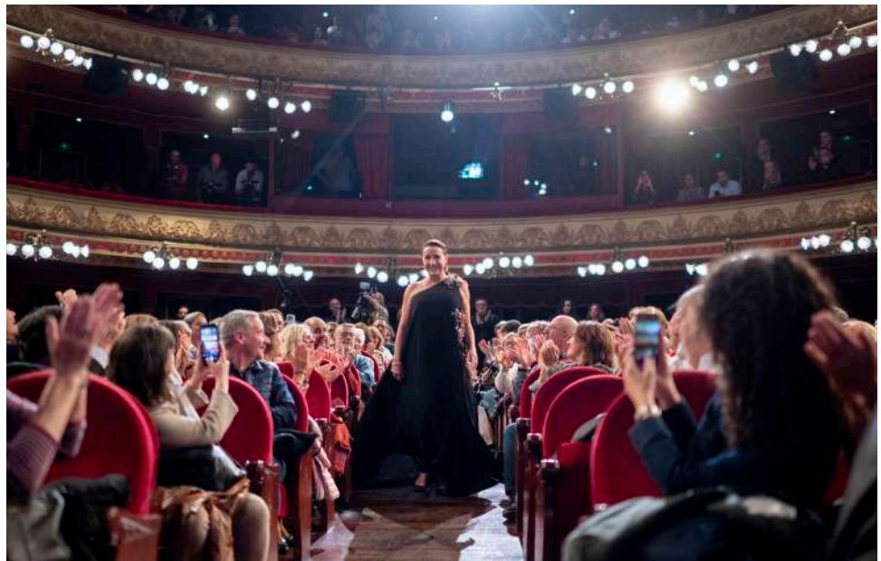
Blanca Portillo entre los aplausos del público, momentos antes de recoger su Espiga de Honor