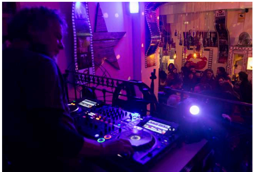
Una de las propuestas de Alhambra Seminci Noche, en el Kafka