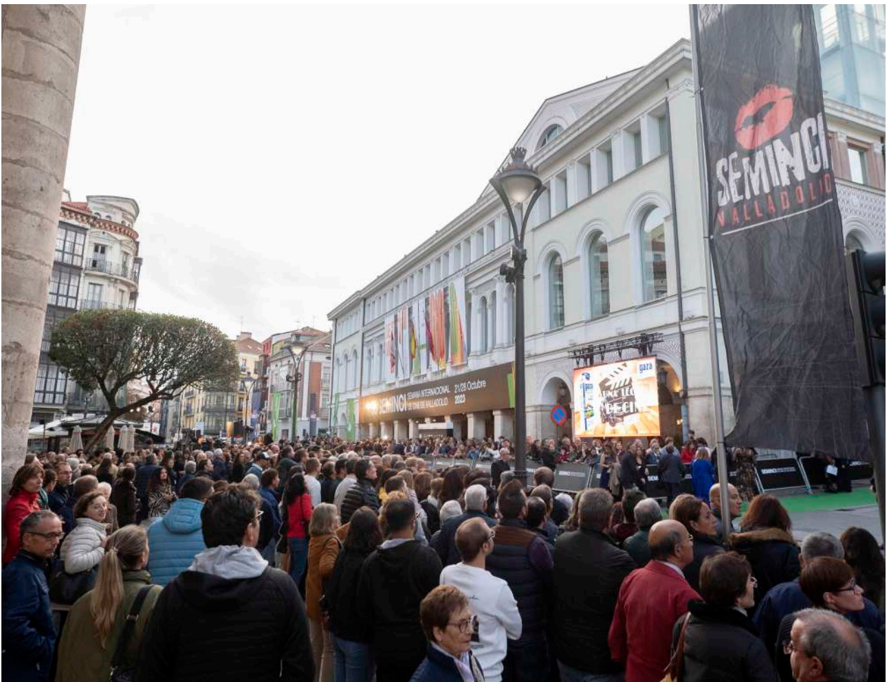
Expectación a las puertas del Teatro Calderón antes de la gala inaugural de la edición