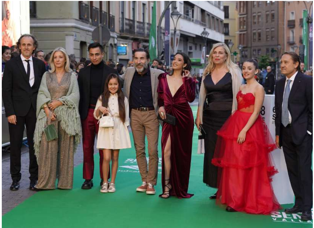
Equipo de La contadora de películas , de Lone Scherfig, que inauguró la 68 Seminci