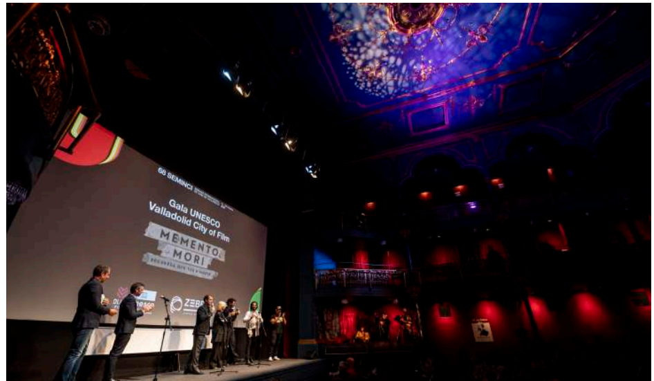
Gala Valladolid Unesco City of Film, en la que se estrenó la serie Memento Mori