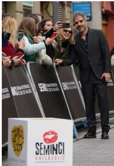
Ernesto Sevilla atiende a sus fans