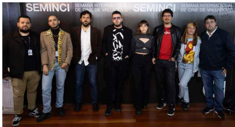
Participantes en el apartado Castilla y León en Corto