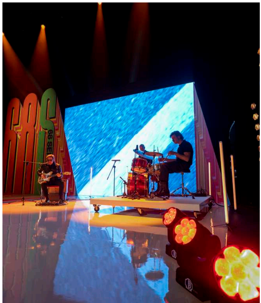
La actriz Marta Nieto en el papel de presentadora de la gala de apertura, a la que puso música el grupo Guadalupe Plata