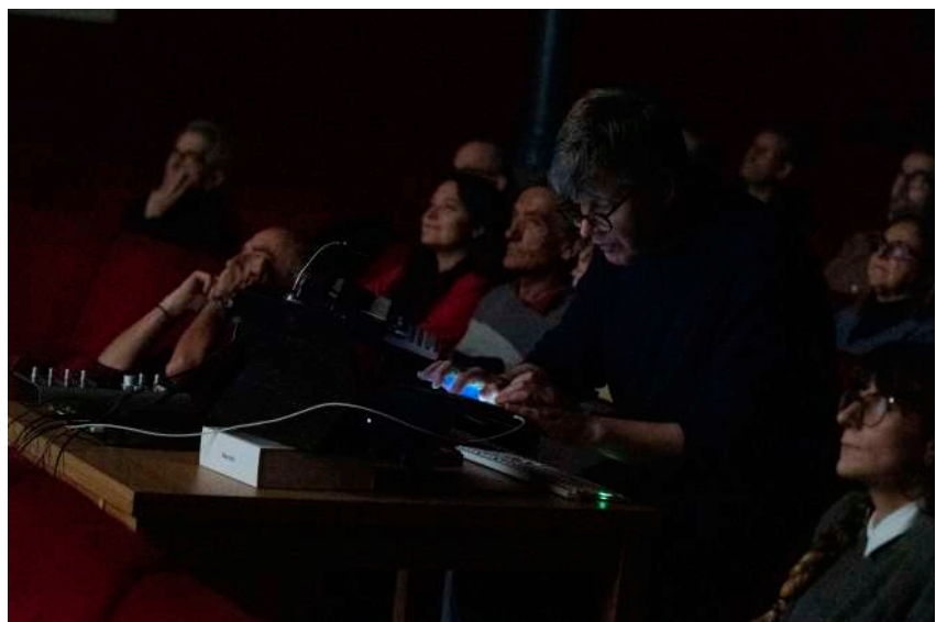
Creación sonora de Abel Hernández en la proyección de Lucha de corazones , de Codina