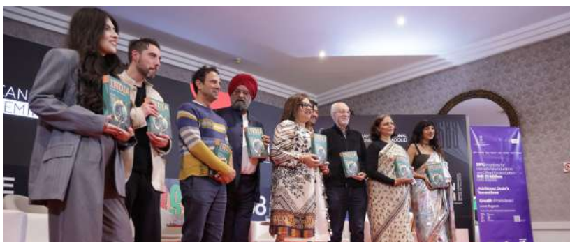
Mesa redonda y presentación del libro El cine de la India. Tradiciones, rupturas y disidencias