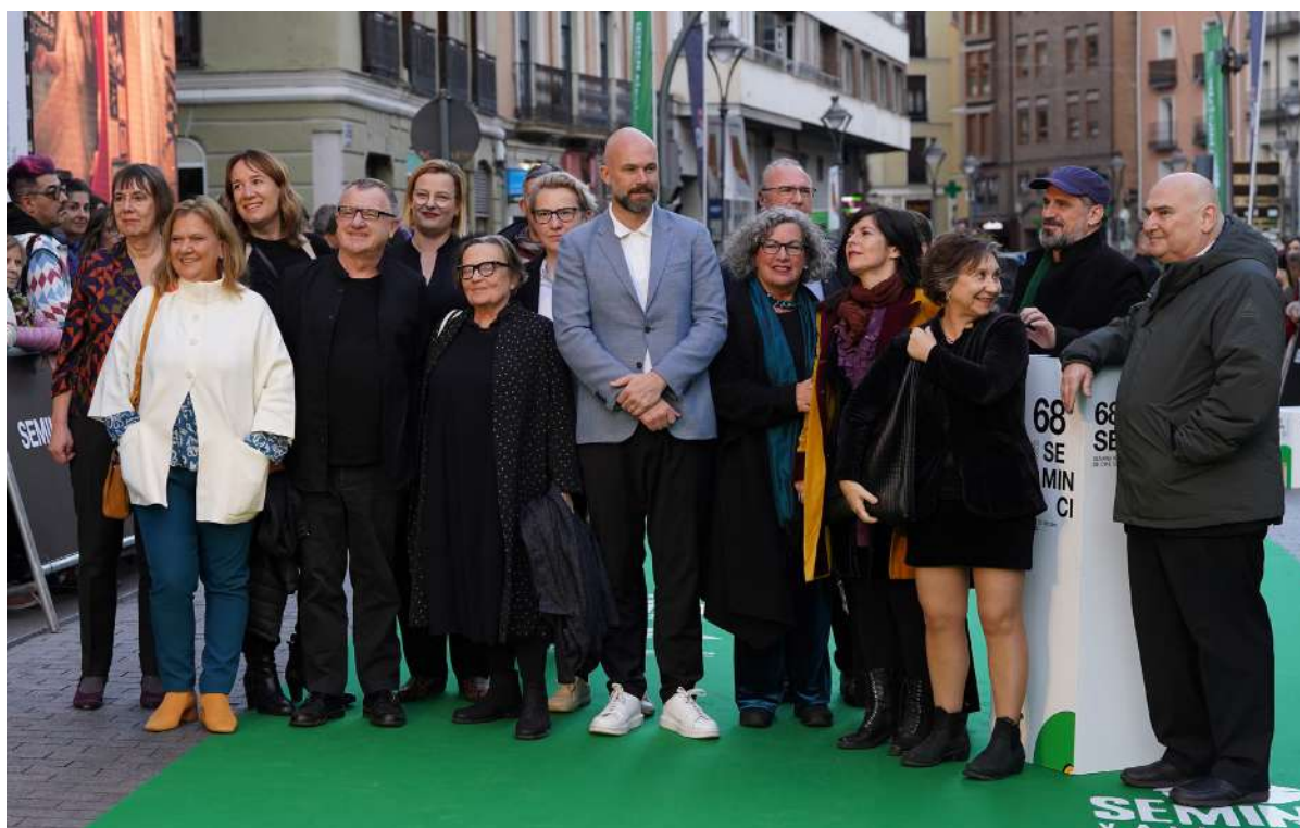
La delegación de la Academia del Cine Europeo en la alfombra verde de la gala inaugural