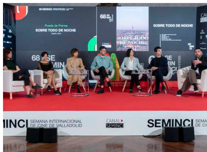
Equipos de Que nadie duerma (Antonio Méndez Esparza) y Sobre todo de noche (Víctor Iriarte), presentadas en la Sección Oficial