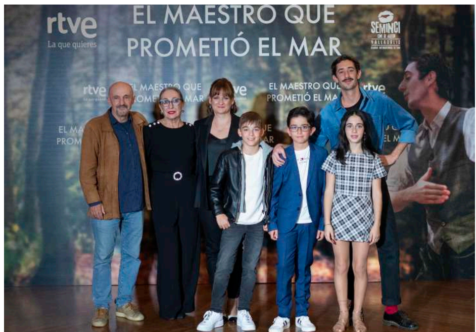
La gala de RTVE brindó el estreno mundial de El maestro que prometió el mar , de Patricia Font