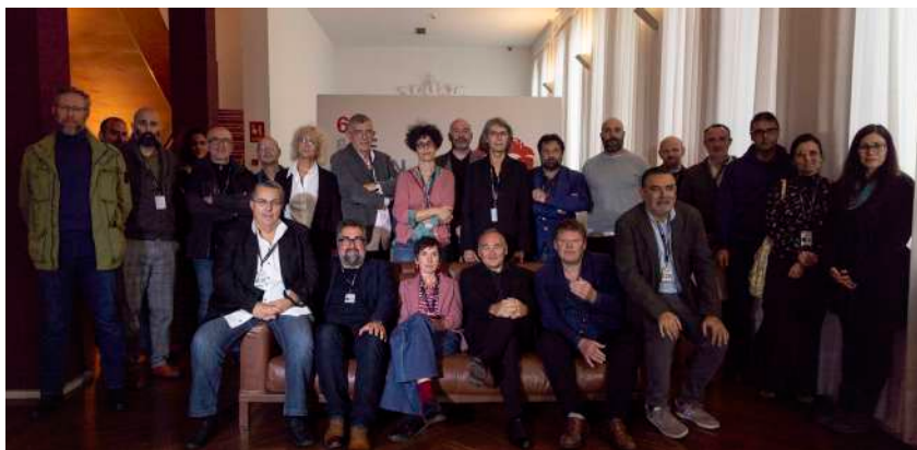
Participantes en las mesas redondas de la jornada de Memoria y Utopía