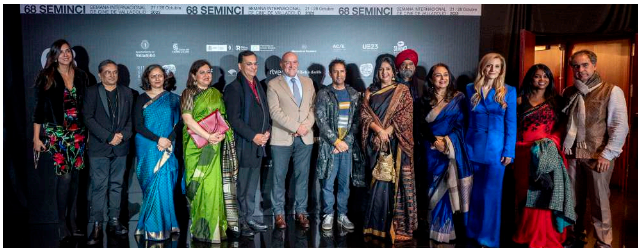
Photocall previo a la gala dedicada al país invitado, con representantes institucionales y del cine indio