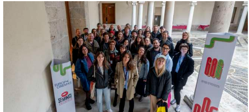
Participantes en el Laboratorio de Innovación y Desarrollo de Audiencias de Europa Cinemas