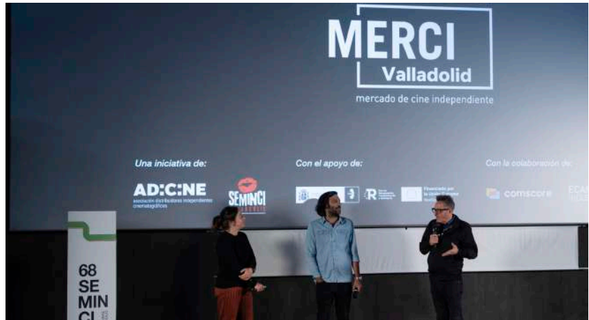
Sesión de clausura del Mercado de Cine Independiente MERCI Valladolid

A incentivar la creación entre autores emergentes se encaminaron dos iniciativas impulsadas en colaboración