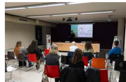
Actividades de la ECAM: charlas de La Incubadora y el Castilla y León New Talent

con la ECAM. La Seminci, el palentino Aguilar Film Festival y la Filmoteca de Castilla y León respaldaron el Castilla y León New Talent / Premio Open ECAM para poner en pie un proyecto de cortometraje. La actividad contó con tutorizaciones de la productora y miembro de la Academia del Cine Europeo