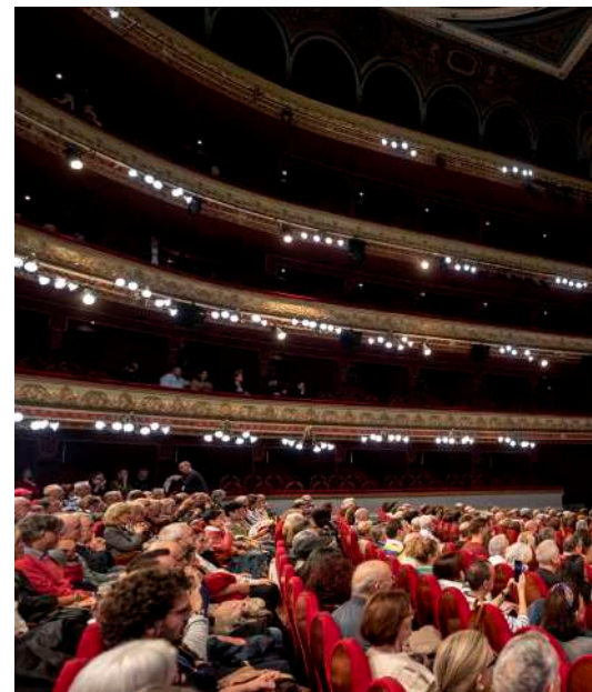
Homenajes a Charlotte Rampling, que avanza por el patio de butacas del Calderón, y Nathalie Baye, que recibió otra Espiga de Honor de la 68 edición