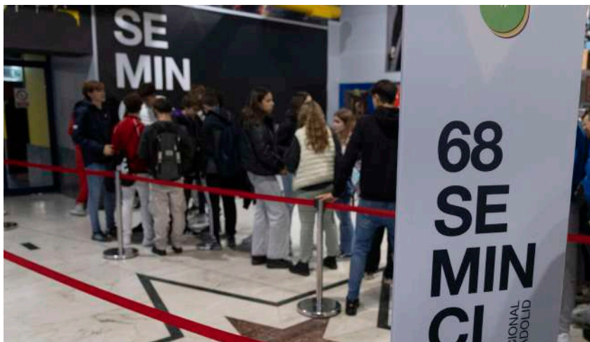
Adolescentes a la entrada en proyecciones de Seminci Joven

Educación Seminci también se reforzó con recursos didácticos ofrecidos en la web del festival y relacionados con los títulos programados en Miniminci y Ventana Cinéfila, guías que complemen-