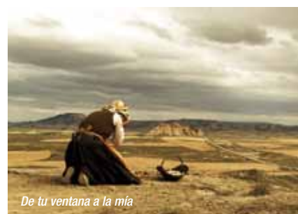
De tu ventana a la mía