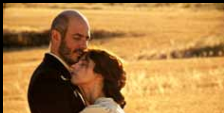
De tu ventana a la mía

Maryam Keshavarz, EE.UU./Irán/Libano/Francia, 2011