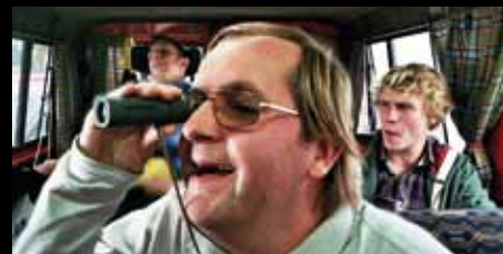
Hasta la vista