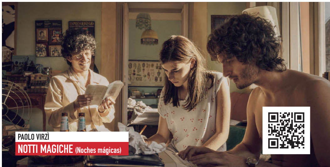
PAOLO VIRZÌ NOTTI MAGICHE (Noches mágicas)