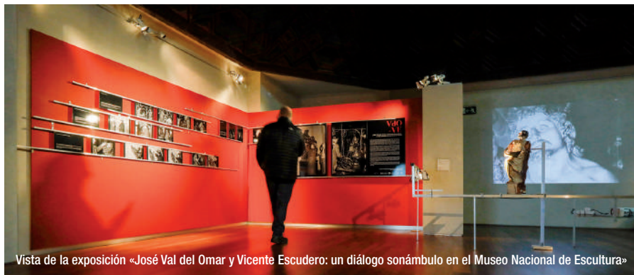
Vista de la exposición «José Val del Omar y Vicente Escudero: un diálogo sonámbulo en el Museo Nacional de Escultura»