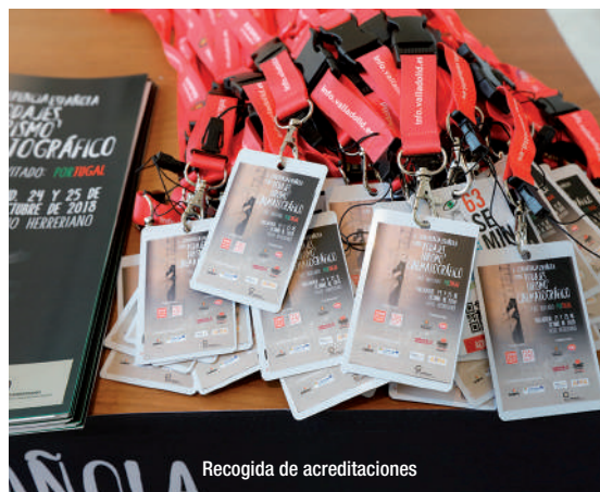
Recogida de acreditaciones

Los participantes en la jornada coincidieron en la importancia de trabajar conjuntamente desde todas las administraciones para conseguirlo, un tema que ya se planteó en la anterior reunión celebrada en Valladolid en 2016. «En este punto estamos, es fundamental la