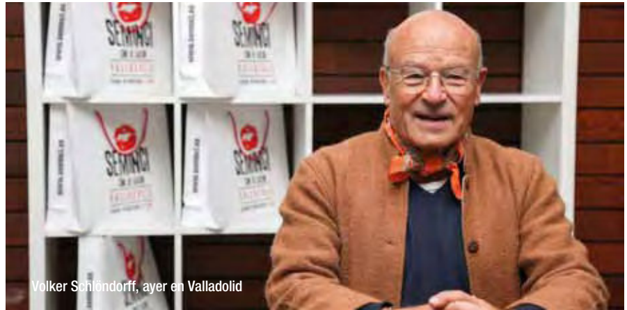
Volker Schlöndorff, ayer en Valladolid

El cineasta Volker Schlöndorff pasó por Valladolid para presentar ayer su última película, Diplomatie (Diplomacia) . El oscurizado artífice de El tambor de hojalata ha mostrado sus reticencias a emprender un segundo largometraje con la II Guerra Mundial como telón de fondo, pero finalmente ha admitido su “implicación natural con París” y se ha declarado “un hijo de la reconciliación”.