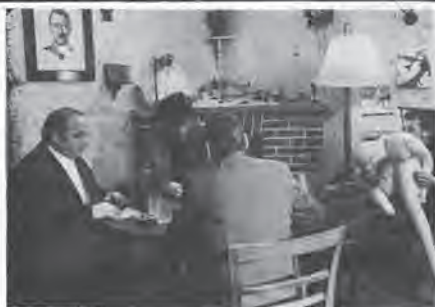
«Kassbach», de Peter Patzak