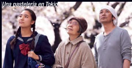
Naomi Kawase. Fra/Jap/Ale, 2014