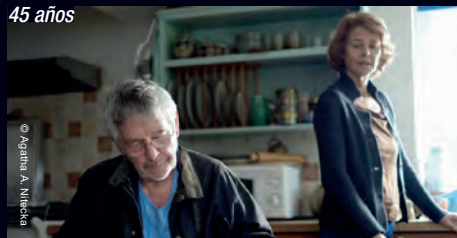
Andrew Haigh. Reino Unido, 2015