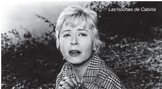
Las noches de Cabiria

...las dos primeras ediciones de la Seminci no concedieron galardón alguno? El premio Don Bosco comenzó a entregarse en el tercer año de vida del certamen. En aquella ocasión, el oro recayó en El que debe morir , de Jules Dassin, mientras que la plata fue para Las noches de Cabiria , de Federico Fellini. Esta película protagonizó el primer escándalo del festival, ante la negativa del arzobispo de la proyección de una cinta «alejada del orden moral y religioso».