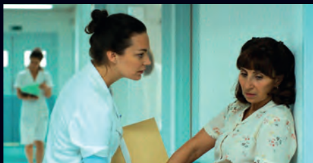
Robert Guédiguian. Francia/Líbano, 2015