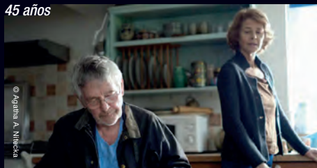
Andrew Haigh. Reino Unido, 2015