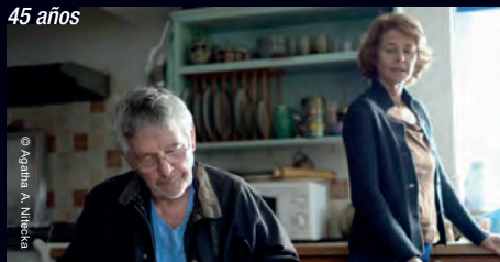
Andrew Haigh. Reino Unido, 2015