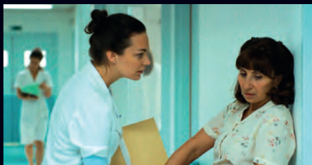
Robert Guédiguian. Francia/Líbano, 2015