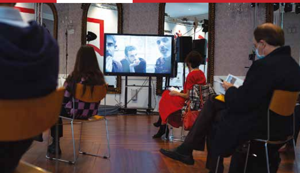
El director y los protagonistas de Here We Are durante la rueda de prensa transmitida por Canal Seminci