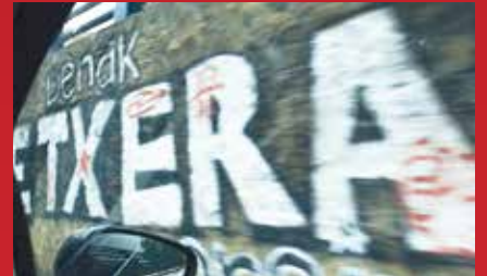
Bajo el silencio

BAJO EL SILENCIO (UNDERNEATH THE SILENCE), DE IÑAKI ARTETA COLOMBIA IN MY ARMS (COLOMBIA FUE NUESTRA), DE JENNI KIVISTÖ Y JUSSI RASTAS