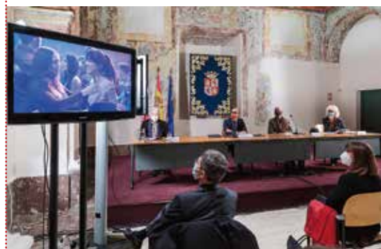
Presentación de la iniciativa 'Seminci Comunidad'

Este nuevo plan para llevar el cine independiente y de autor por toda Castilla y León se pondrá en marcha tras esta 65 edición, con la previsión de hacerlo realidad antes de la siguiente. La Consejería, la Seminci y la FilMOTECA de Castilla y León se alían en