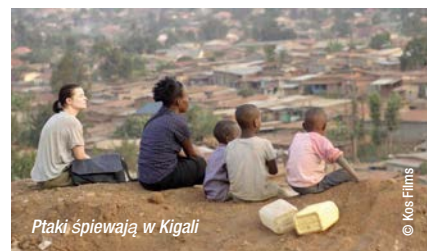
Ptaki śpiewają w Kigali