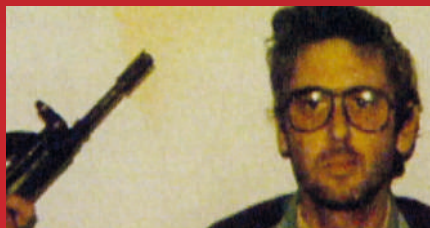
Lagun y la resistencia frente a ETA

THE CAVE (LA CUEVA) , DE FERAS FAYYAD LAGUN Y LA RESISTENCIA FRENTE A ETA , DE BELÉN VERDUGO YUB MENH BONG KEUNH OUN NHO NHIM (LAST NIGHT I SAW YOU SMILING) , DE KAVICH NEANG