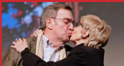
Pedro Olea y Concha Velasco en el homenaje al director