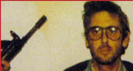
Lagun y la resistencia frente a ETA

THE CAVE (LA CUEVA) , DE FERAS FAYYAD LAGUN Y LA RESISTENCIA FRENTE A ETA , DE BELÉN VERDUGO YUB MENH BONG KEUNH OUN NHO NHIM (LAST NIGHT I SAW YOU SMILING) , DE KAVICH NEANG