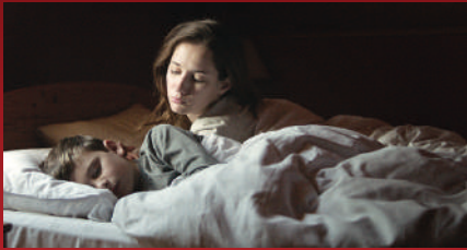
A Certain Kind of Silence

MOOTHON (THE ELDER ONE) , DE GEETU MOHANDAS TICHÉ DOTEKY (A CERTAIN KIND OF SILENCE) , DE MICHAL HOGENAUER