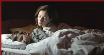
A Certain Kind of Silence

MOOTHON (THE ELDER ONE) , DE GEETU MOHANDAS TICHÉ DOTEKY (A CERTAIN KIND OF SILENCE) , DE MICHAL HOGENAUER