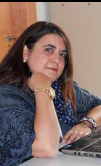
RESPONSABLE PUBLICACIONES: EVA RAQUEL