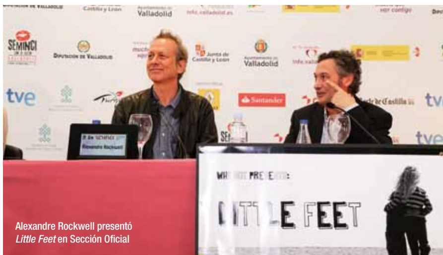
Alexandre Rockwell presentó Little Feet en Sección Oficial

El director Alexandre Rockwell, artífice de In the Soap y Somebody to Love , además de uno de los segmentos de la cinta de episodios Four Rooms ; presentó ayer en la 59ª Seminci su película Little Feet