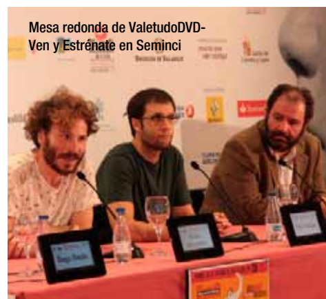
Mesa redonda de ValetudoDVD-Ven y Estrénate en Seminci

Los directores Óscar Aibar ( El bosque ) y Pau Teixidor ( Purgatorio ) y el actor y realizador Rubén Ochandiano ( Los abrazos rotos ), miembros del jurado de la edición 2014 de ValetudoDVD-Ven y Estrénate en Seminci, participaron antes de este maratón de cortometrajes en una mesa redonda que, bajo el título 'Breve manual de supervivencia en el audiovisual' sirvió de repaso a sus carreras cinematográficas.