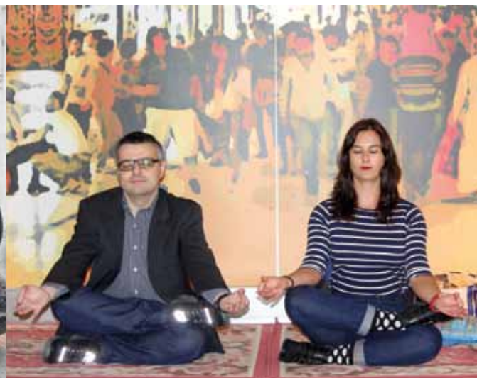
COORDINACIÓN GENERAL Y GESTIÓN CINEMATOGRAFICA: JAIME Y CAROLINA