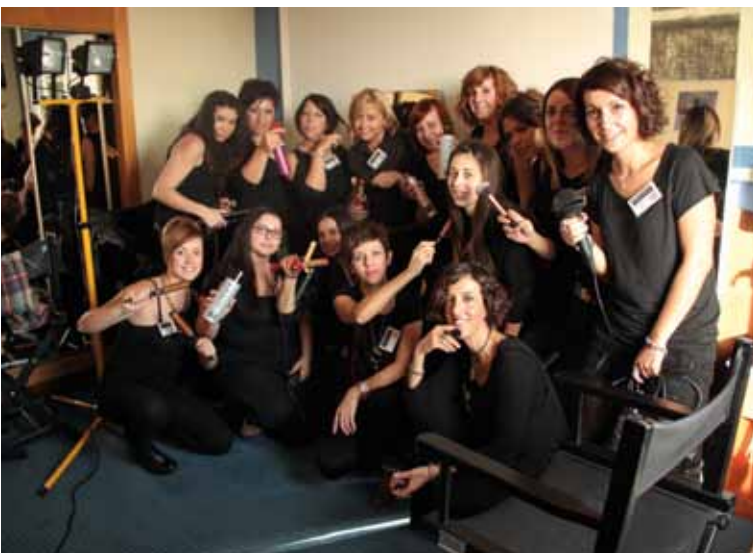
MAQUILLAJE Y PELUQUERÍA