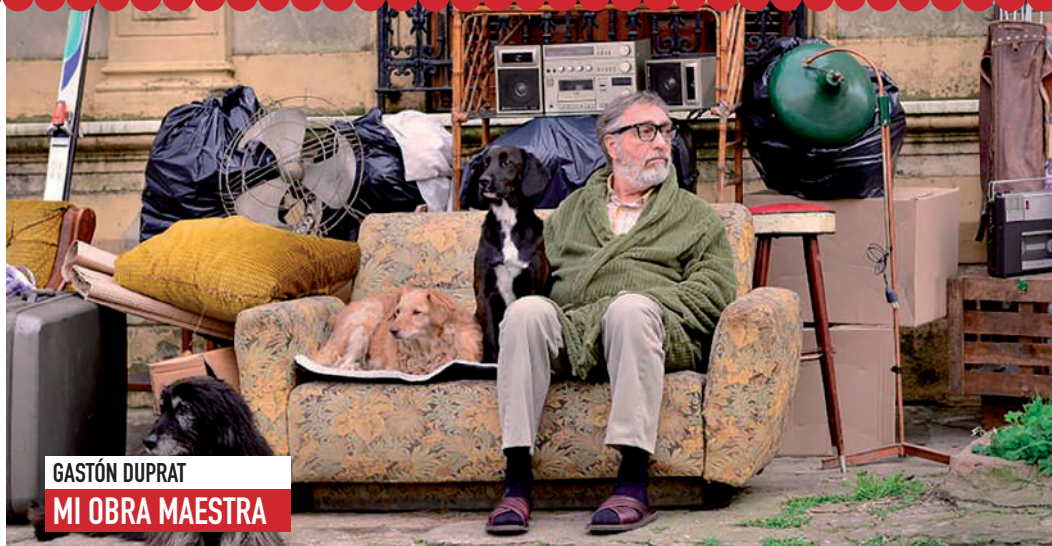
GASTÓN DUPRAT MI OBRA MAESTRA

ESPIGAS DE HONOR CONTRA LOS PREJUICIOS ANTE EL CINE NACIONAL