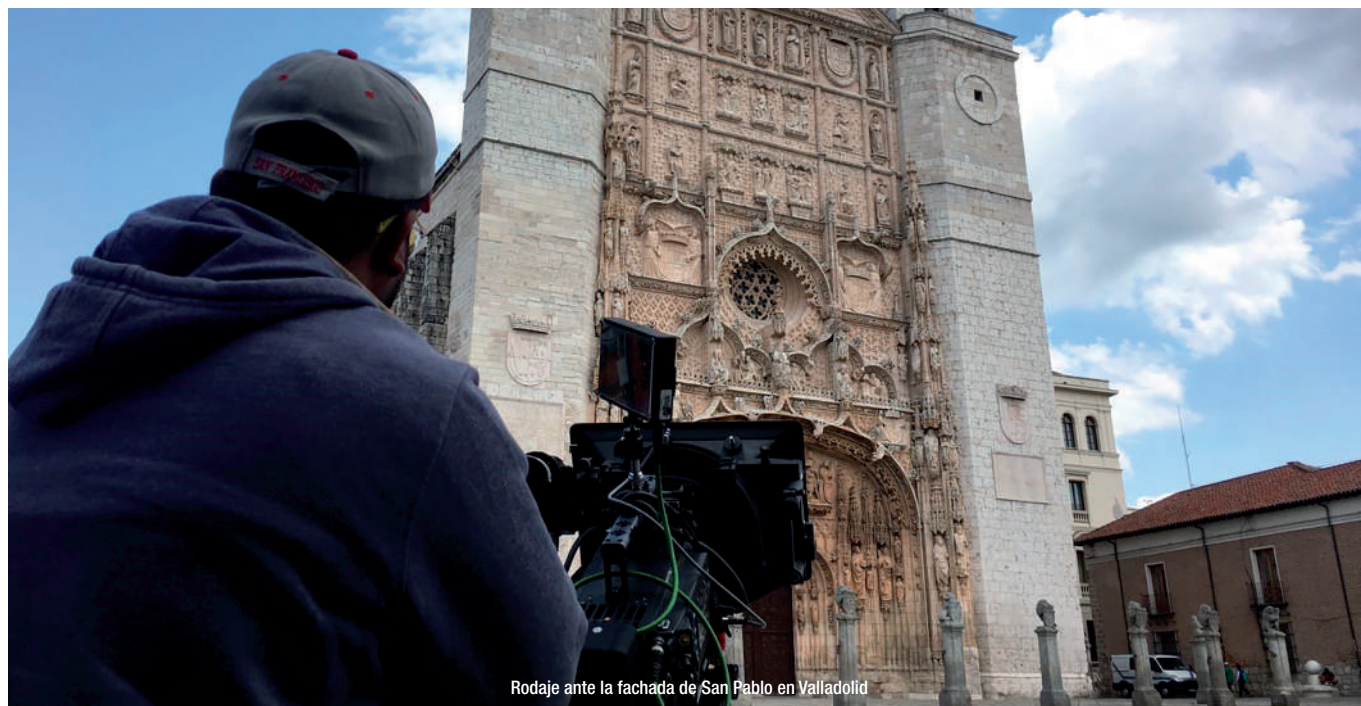
Rodaje ante la fachada de San Pablo en Valladolid