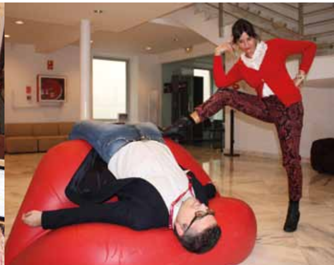
COORDINACIÓN GENERAL Y GESTIÓN CINEMATOGRÁFICA: JAIME Y CAROLINA