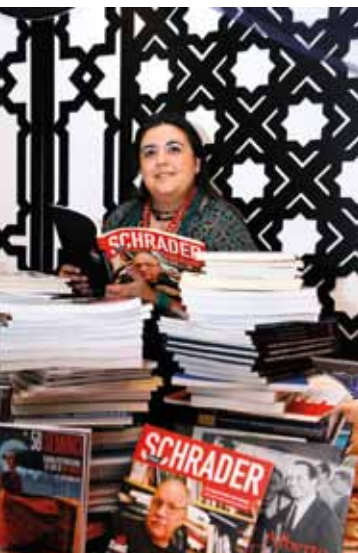
RESPONSABLE PUBLICACIONES: EVA RAQUEL