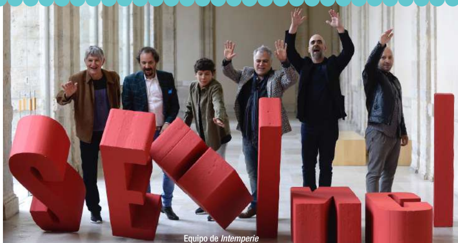
Equipo de Intemperie