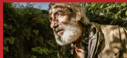
Un tiempo precioso