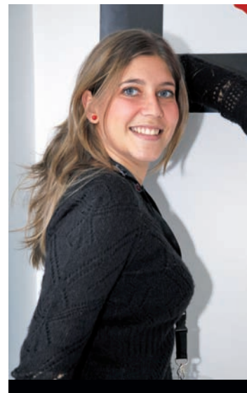
PUBLICIDAD Y PATROCINIOS: ANA