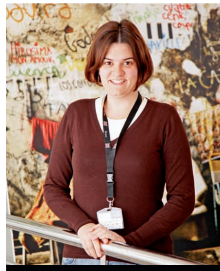
INVITADOS (AGENCIA): BEA