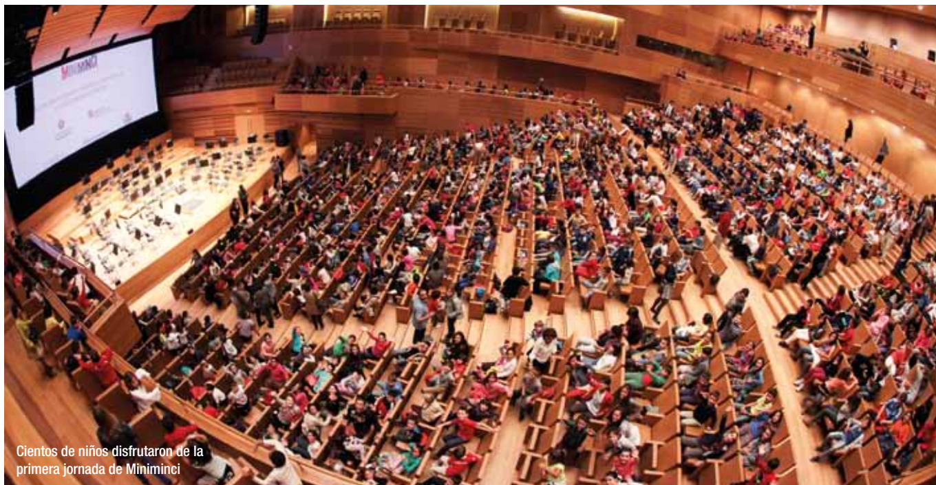
Cientos de niños disfrutaron de la primera jornada de Miniminci

Miles de niños de la comunidad disfrutarán durante esta semana de proyecciones destinadas al público más pequeño dentro de la sección Miniminci, que repite en la Seminci después del éxito del año pasado. Ayer los primeros afortunados abarrotaron el Auditorio Miguel Delibes para ver el título con el que arranca este ciclo, La fórmula del doctor Funes .