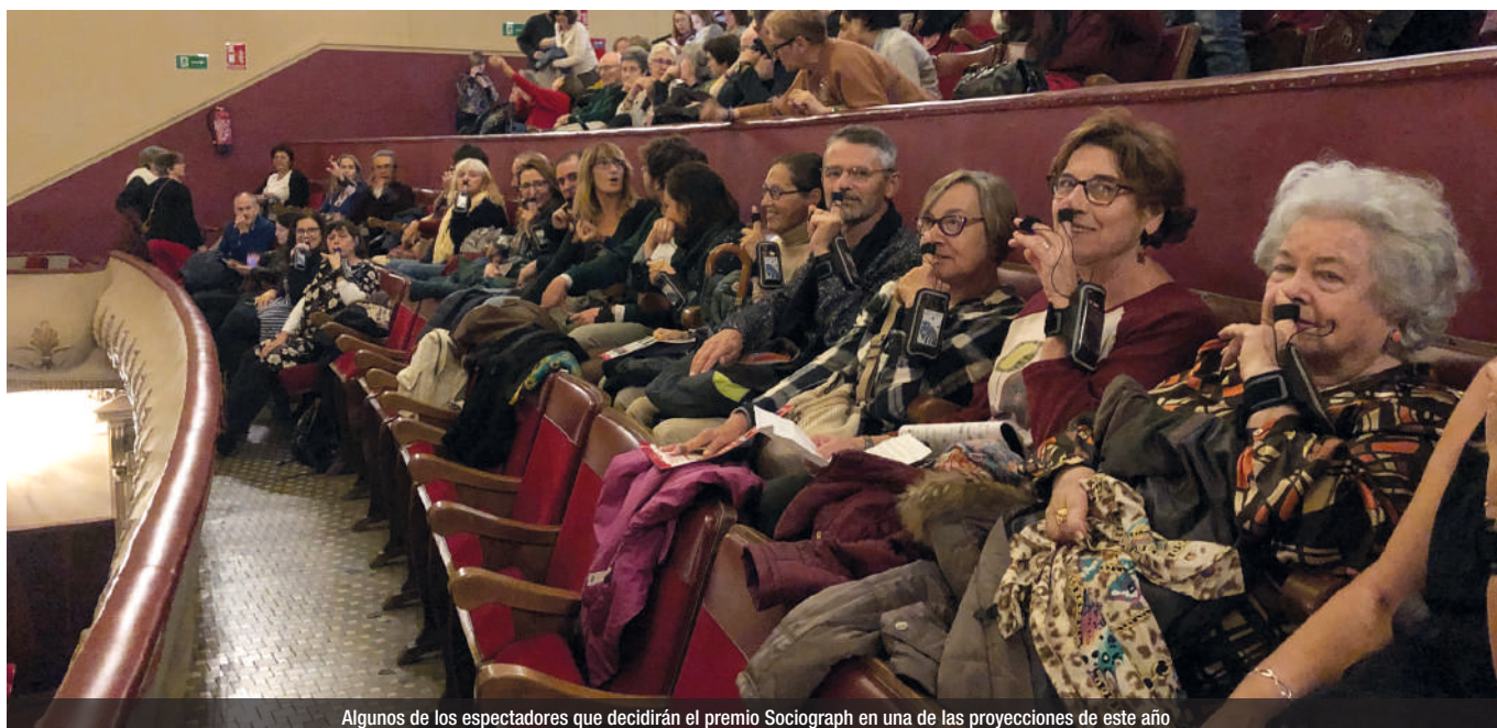
Algunos de los espectadores que decidirán el premio Sociograph en una de las proyecciones de este año