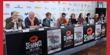
Participantes en la mesa redonda del país invitado

LA INDUSTRIA GEORGIANA: EJEMPLO DEL RESURGIR DEL CINE DE AUTOR IMPULSADO POR LAS INSTITUCIONES