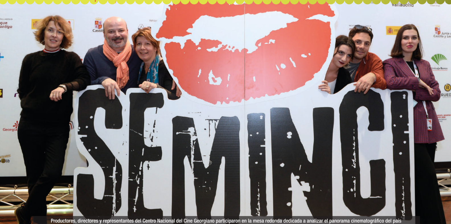
Productores, directores y representantes del Centro Nacional del Cine Georgiano participaron en la mesa redonda dedicada a analizar el panorama cinematográfico del país