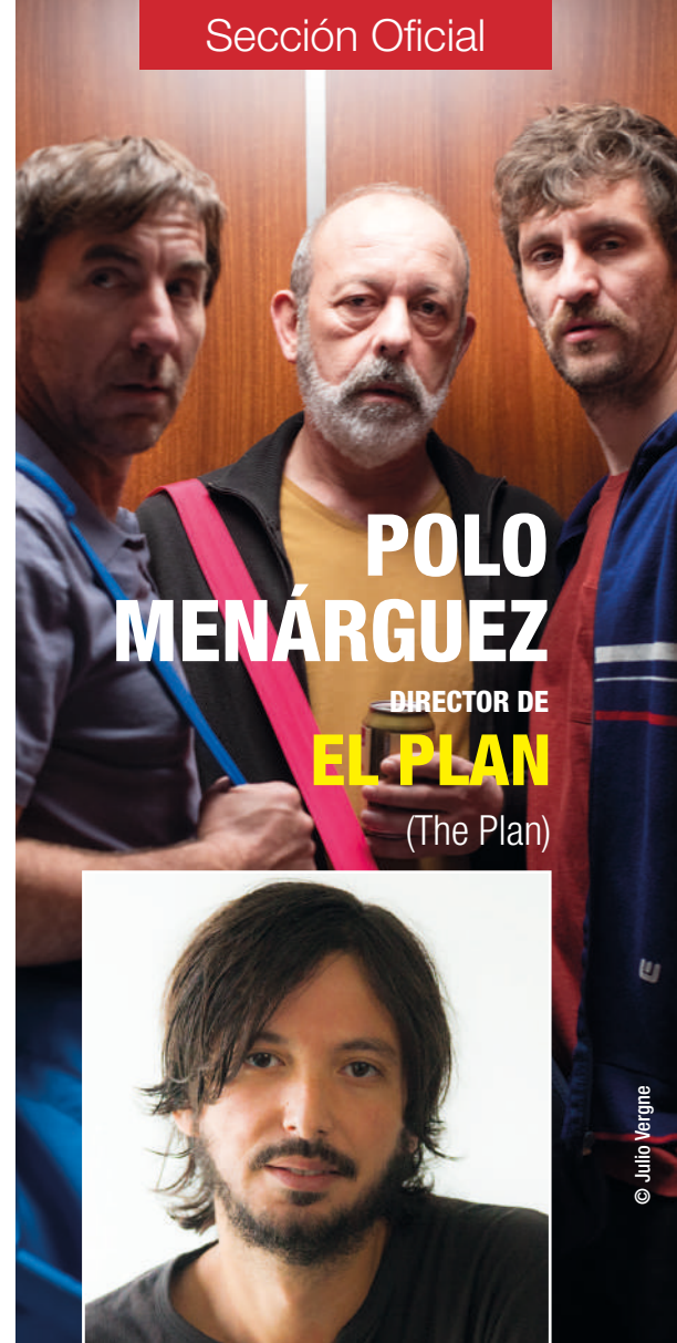
POLO MENÁRGUEZ DIRECTOR DE EL PLAN (The Plan)

Nadie es un perdedor porque sí, no es una enfermedad. La identidad del «perdedor» en un contexto sociopolítico se refiere al juego del éxito en el capitalismo. Gana el que llega a un nivel social elevado diseñado por las estructuras de poder, y pierde el que se queda abajo, sin privilegios. Es un juego injusto, donde nadie empieza la carrera desde la misma pole. La realidad es que muchos nacen perdiendo y unos pocos nacen ganando. El sistema ofrece la esperanza de que es permeable y está abierto a recompensar a los perdedores que acaben ganando la