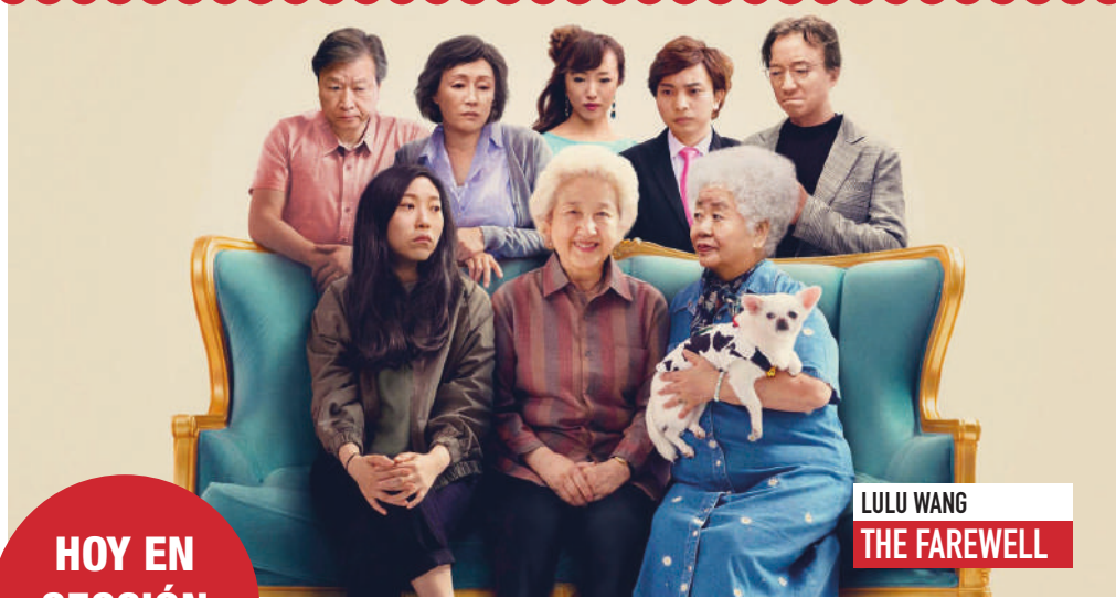
LULU WANG THE FAREWELL